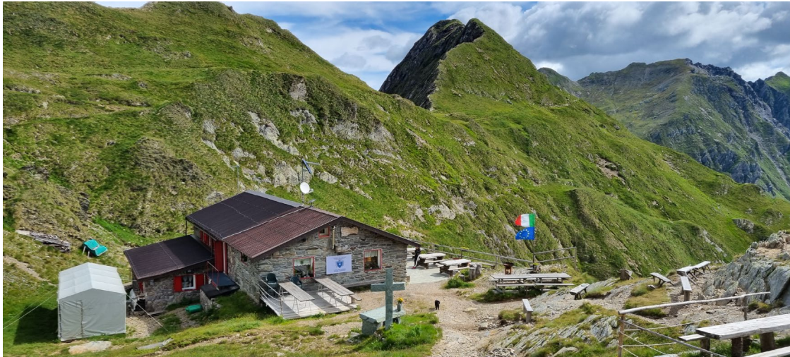
Il rifugio Tagliaferri