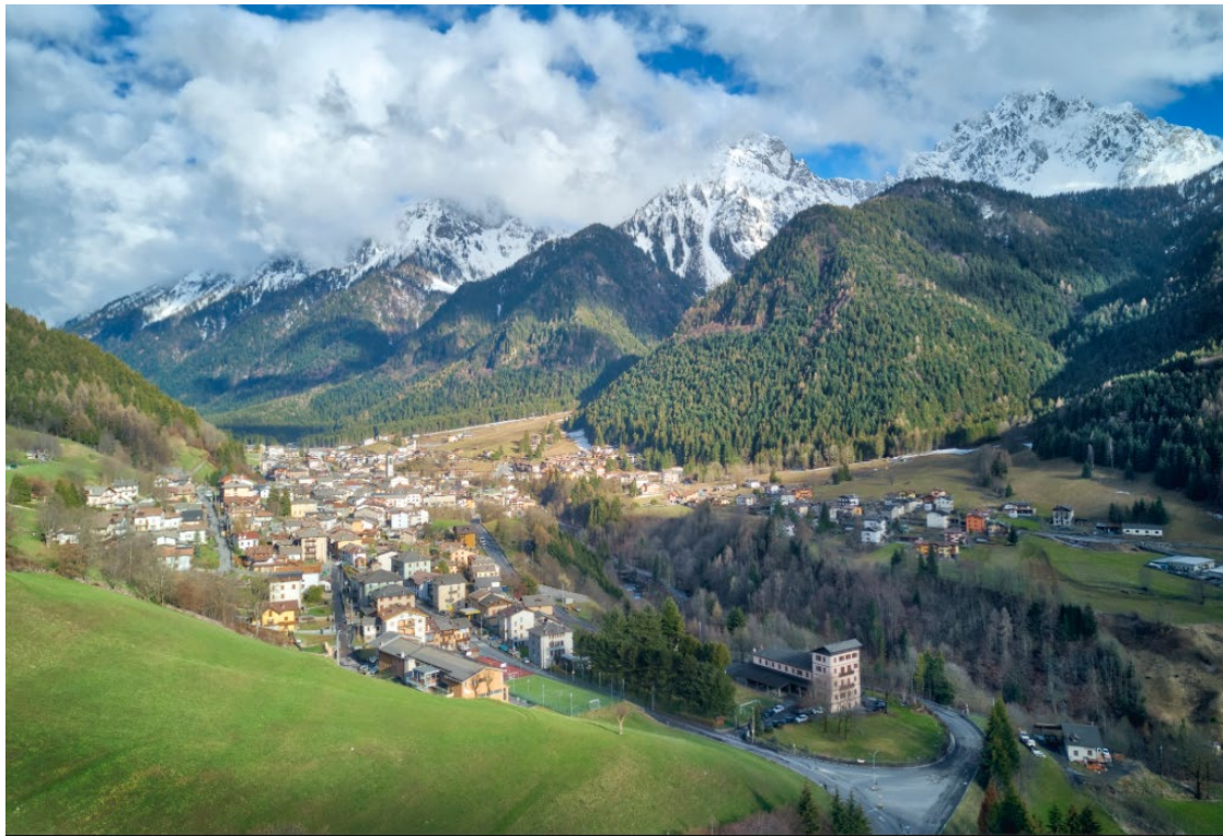
Lo stupendo panorama del paese di Schilpario

Ce ne andiamo tutti in Val di Scalve, ai piedi delle stupende Alpi Orobie!