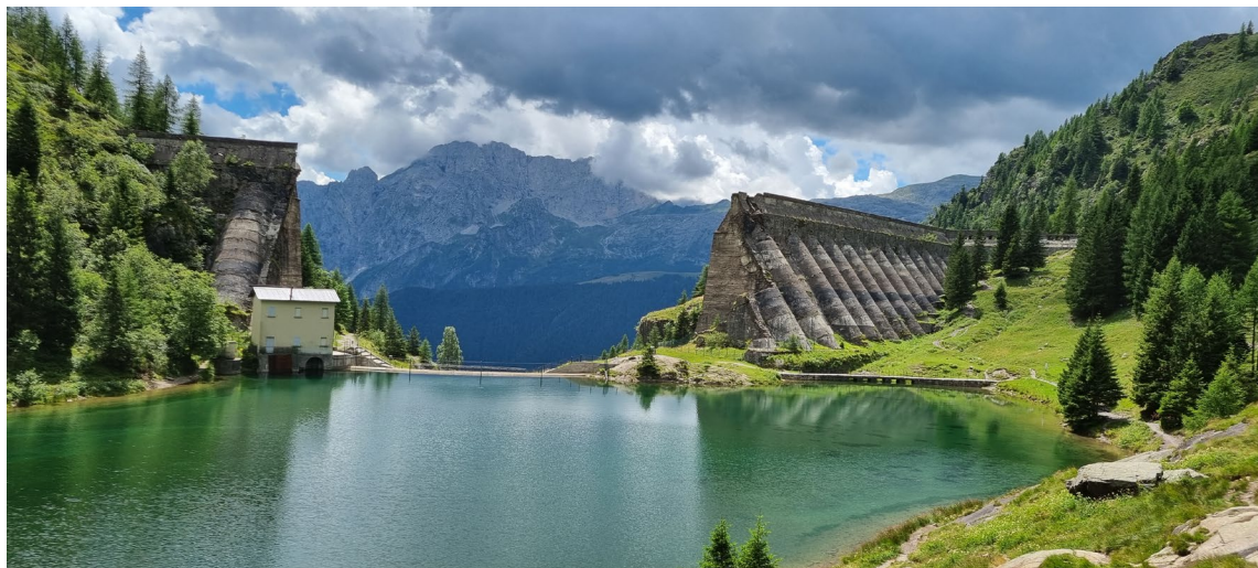
L'incredibile diga di Gleno